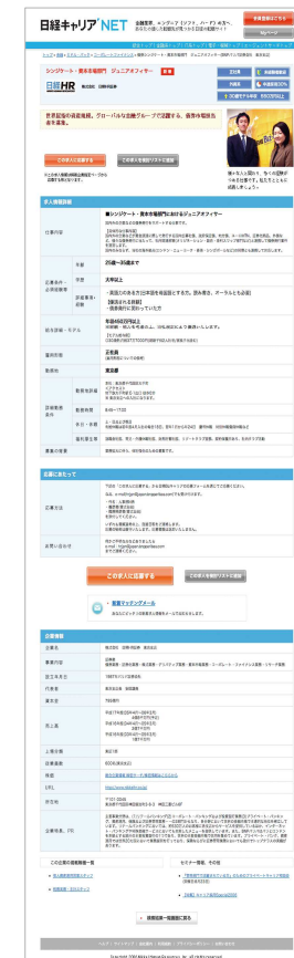
クイック画面イメージ