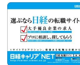
交通広告掲載イメージ